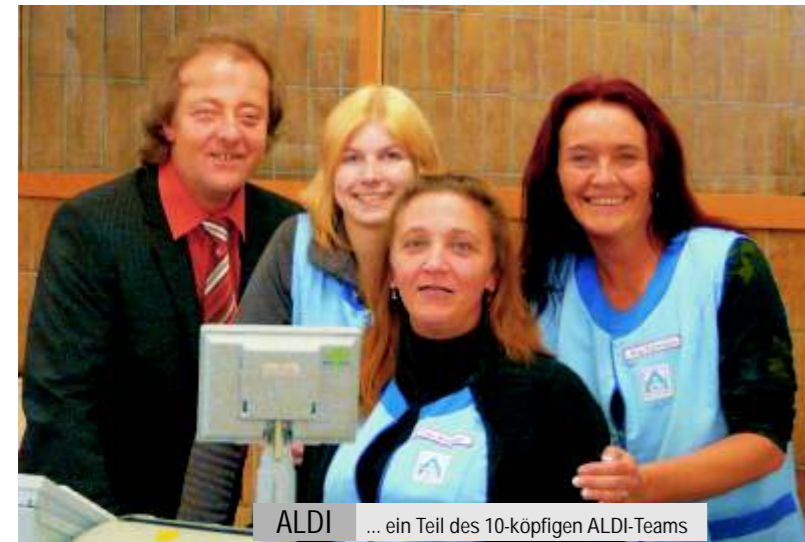
ALDI ... ein Teil des 10-köpfigen ALDI-Teams

der zentrale Punkt des Betriebsklimas. "Unsere Philosophie ist in erster Linie natürlich das ALDI-Prinzip 'Qualität ganz oben - Preis ganz unten' und dazu vor allem hier in Hage Teamgeist, Einsatz und Freundlichkeit," sagt der Chef.