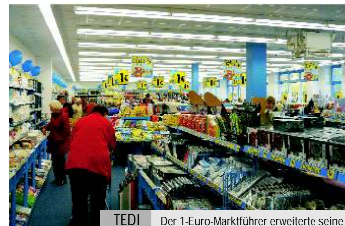
TEDI Der 1-Euro-Marktführer erweiterte seine Verkaufsfläche im EDENHOF

Während die Produktpalette für Menschen jeden Alters ausgelegt ist, setzt das Unternehmen seit der Gründung im Jahr 2004 auf einen jungen Personalstamm. In sechs verschiedenen Berufen werden junge Leute bei TEDI ausgebildet. Im EDENHOF HAGE sind derzeit sieben MitarbeiterInnen beschäftigt.