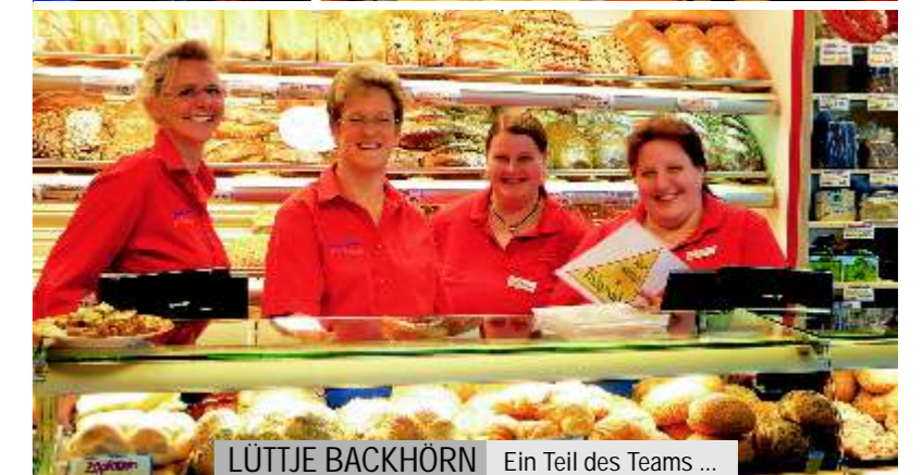
LÜTTJE BACKHÖRN Ein Teil des Teams ...