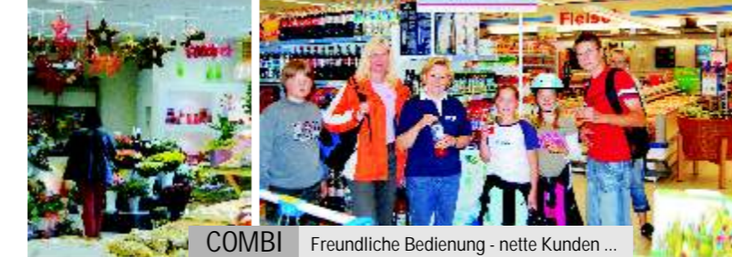
COMBI Freundliche Bedienung - nette Kunden ...