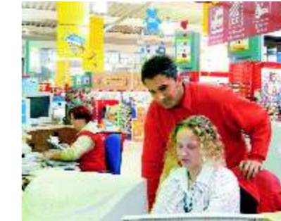
HAGEBAUMARKT Viele Produkte für's Werken und Bauen

Kunden können mit ihren Wünschen und Ideen vorbeikommen, wir hören ihnen zu." Dass der Hagebaumarkt auf dem richtigen Weg ist, belegt die frisch gewonnene Auszeichnung für Einsatz und Umsatzwachstum bei den Eigenmarken.